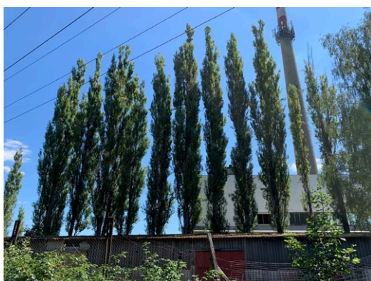
Odumírající stromořadí z Populus nigra 'Italica'