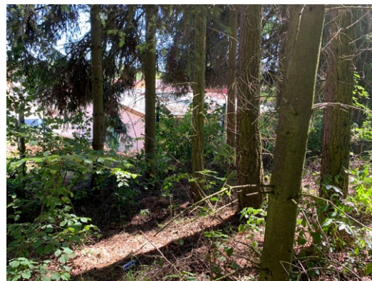
Pohled do smrkového porostu - příliš hustá výsadba stromů, zanedbaná probírka